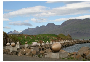
鸟蛋Eggin i Gledivik