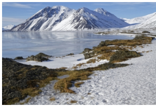
The East Fjords