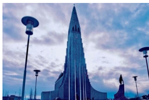
哈尔格林姆斯教堂