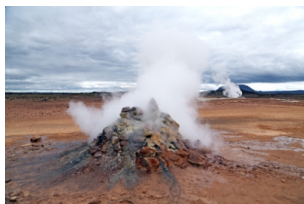
圆锥形火山喷火口