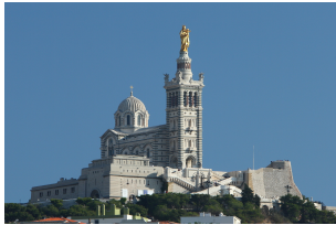
自由行圣母加德大教堂