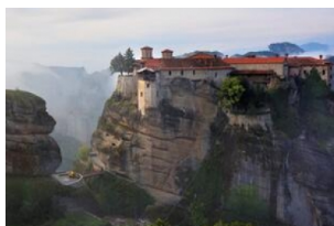
大迈泰奥伦修道院