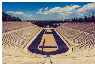
埃匹达鲁斯古剧场