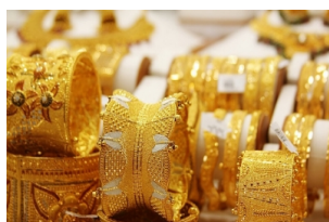
黄金市场和香料市场