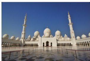
谢赫扎伊德清真寺