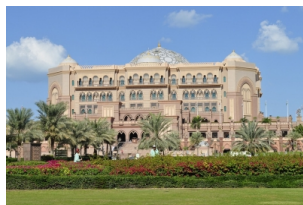
阿布扎比皇宫酒店