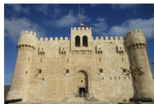
盖贝依城堡（灯塔遗址）