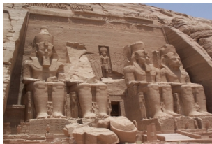
阿布辛贝大小神殿

上午您可以选择在游轮上好好地休息或是游玩阿斯旺城，我们更加推荐您参观埃及著名的【阿布辛贝大小神殿】，领略拉美西斯二世时期古埃及最壮丽的神庙。我们将在凌晨3点随车队前往阿布辛贝。中午回到游轮上享受午餐和短暂休息之后，下午我们将起身前往位于科翁坡市的【科翁坡神庙】，值得一提的是，全埃及乃至全世界最古老的一个日历图案就保存在神庙当中。在一天的忙碌行程结束之后，继续回到我们的豪华游轮上，饱餐之后可以早早地休息，因为明天还有更加精彩的行程在等待我们。