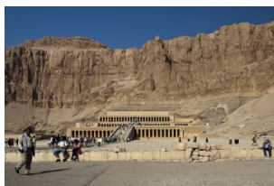
哈特普苏特女王神庙