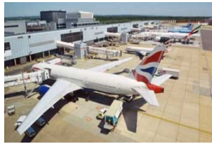
阿塔图尔克机场 Istanbul Ataturk Airport (机场代码 IST)

大街，外观多玛巴赫切新皇宫拍照留念。之后游览美丽的金角湾，乘坐缆车登上洛蒂山瞰整个伊斯坦布尔城区，在山上的咖啡馆自费品尝地道的土耳其咖啡。