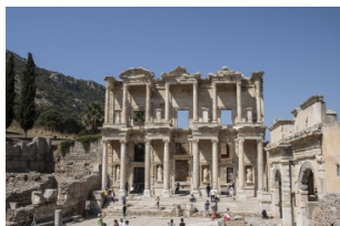
以弗所（埃菲斯）古城遗址