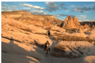
格雷梅露天博物馆

上空徘徊大约45分钟至1小时，最后在农夫的田地中着陆。着陆后当地给每人颁发一份证书，并赠送一杯香槟庆祝这次成功的空中历险。