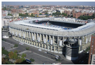
圣地亚哥·伯纳乌体育场