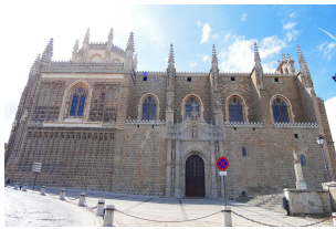
圣胡安皇家修道院