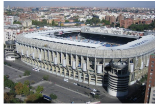
圣地亚哥·伯纳乌体育场