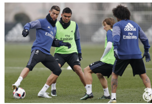
皇马马德里训练基地