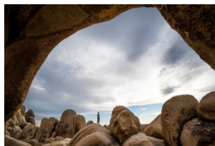
约书亚树国家公园-阳光之乡一日游