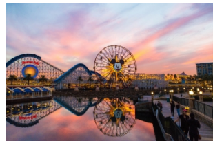
迪斯尼冒险/主题乐园欢乐一日游(二选一)