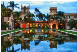
圣地亚哥市区一日游