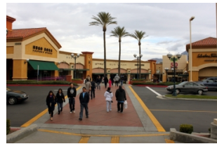
棕榈泉厂家直销店购物一日游