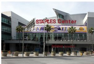
洛杉矶市区精华一日游