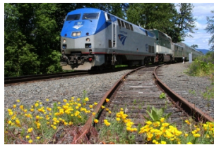
圣地亚哥海景火车一日游