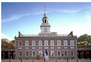
费城国家独立历史公园